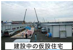
建設中の仮設住宅