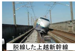
脱線した上越新幹線