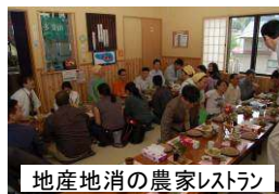
地産地消の農家レストラン