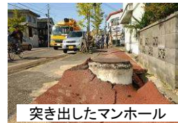
突き出したマンホール